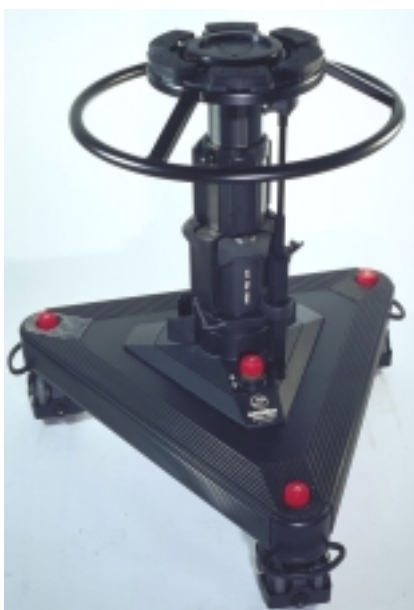
Studio Pedestal 2-75